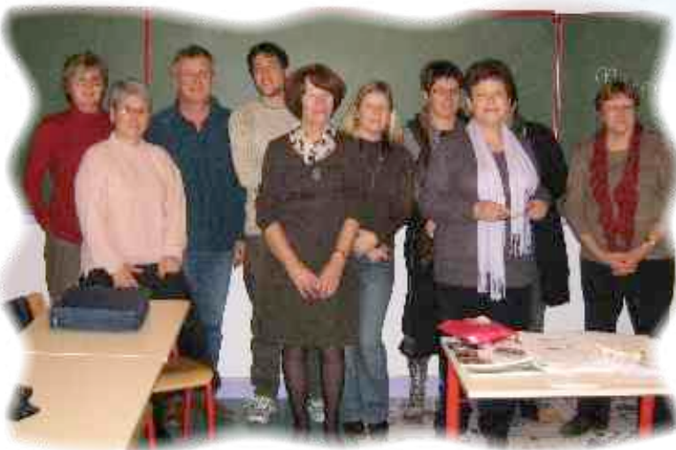
L'atelier anglais de la MJC