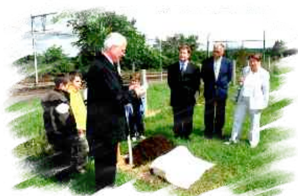
Plantation de "l'arbre de vie" en mai 2008, rendant hommage aux donneurs de sang et d'organes.

En dehors de ces horaires, un répondeur prendra votre message.