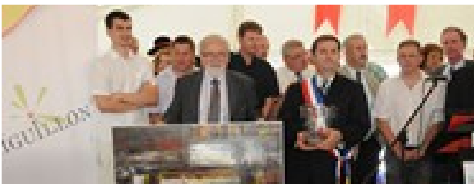
Renouvellement du serment du jumelage

Dimanche 11 juillet : Le serment du jumelage a été renouvelé et la confrérie de l'Oie a intronisé de nouveaux membres. La journée s'est poursuivie avec un repas gascon et des animations musicales.