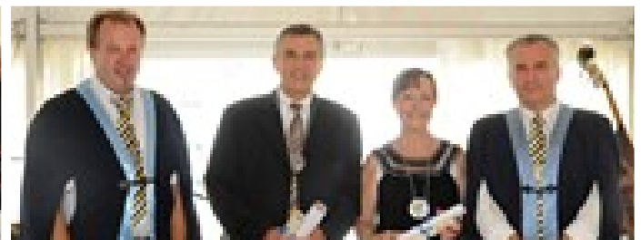
Intronisation du Président du Conseil Général et de la Présidente de l'AFA

Lundi 12 juillet : Une partie des Visétois est rentrée en Belgique et un voyage à Biscarosse a été organisé pour les quelques Belges restants.