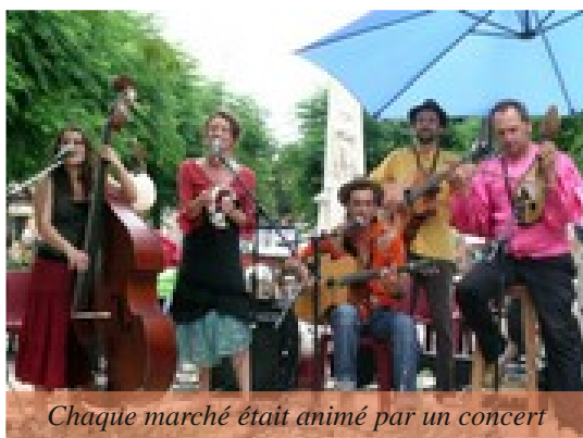
Chaque marché était animé par un concert

Pour animer les soirées estivales des Aiguillonais, l'AFA a organisé, en collaboration avec la Mairie et le CAM, quatre marchés nocturnes biologiques.