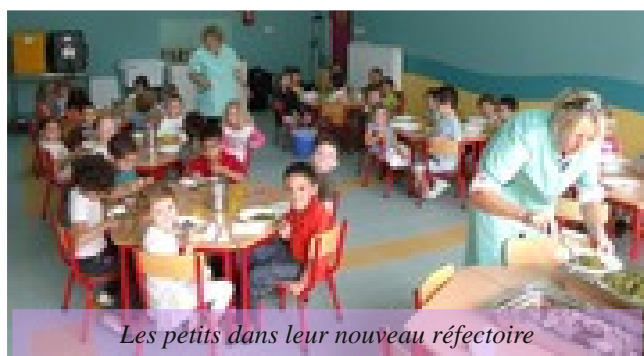
Les petits dans leur nouveau réfectoire

Construit à la place de l'ancien préau, ce réfectoire entièrement insonorisé, leur permet de se restaurer sur place sans avoir à se déplacer à l'école Marcel Pagnol.