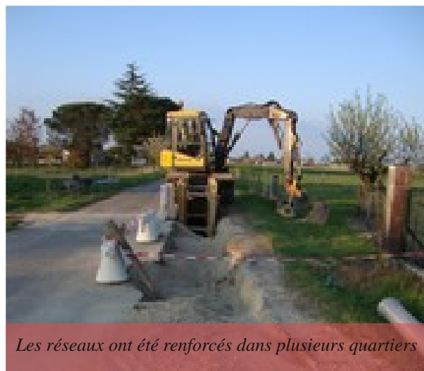
Les réseaux ont été renforcés dans plusieurs quartiers

Pour ce faire, il suffit d'appeler une entreprise compétente qui réalisera les travaux et qui fera contrôler le système d'eau par Véolia Eau avant remblaiement puis délivrera une conformité.