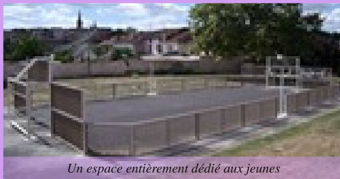
Un espace entièrement dédié aux jeunes

Dans la continuité de ce projet, la Mairie devrait ajouter dès 2011 un terrain de jeu pour les 3-8 ans et un skate parc pour les passionnés de glisse.