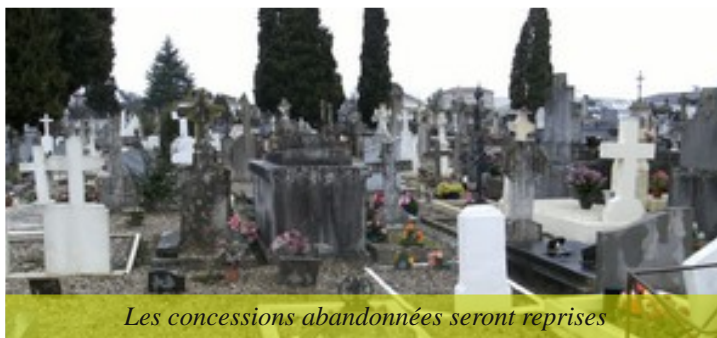
Les concessions abandonnées seront reprises

Pour tout renseignement complémentaire, s'adresser à la Mairie.