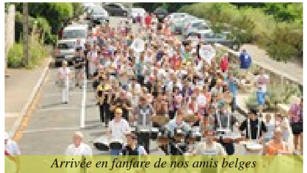
Arrivée en fanfare de nos amis belges

Retour en images sur cet événement populaire inoubliable :