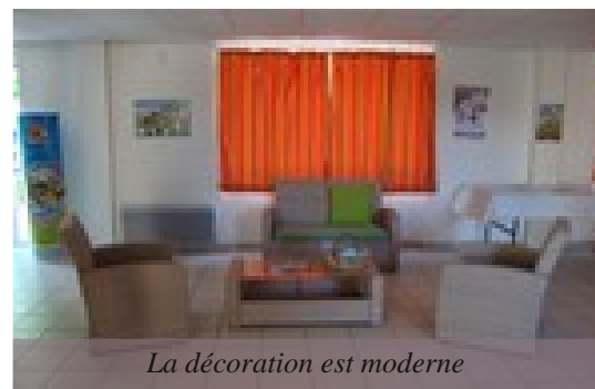
La décoration est moderne

Grâce aux efforts entrepris, le fameux label « Gîtes de France » a été décerné. Dès l'an prochain, des séjours culturels et sportifs devraient être proposés.