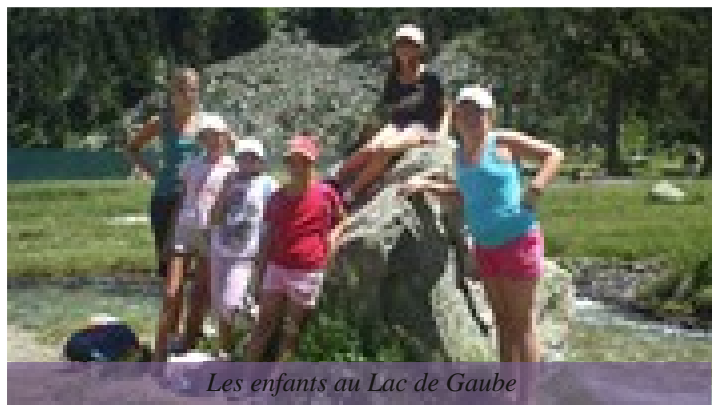
Les enfants au Lac de Gaube