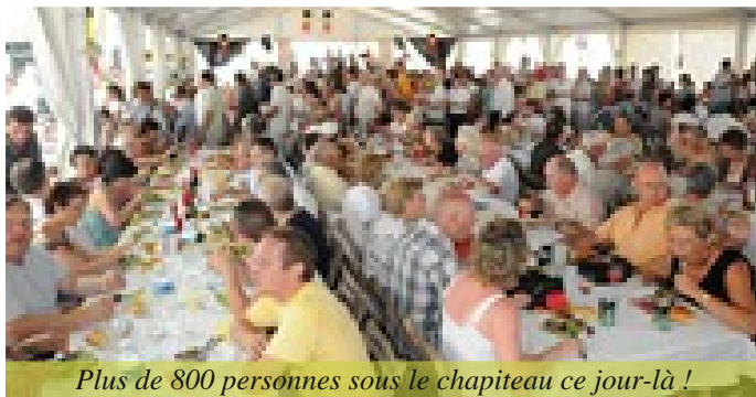
Plus de 800 personnes sous le chapiteau ce jour-là !

Samedi 10 juillet : Placée sous le signe du sport, de nombreuses animations et rencontres sportives ont été organisées. La journée a été clôturée par une soirée endiablée avec le groupe Brazil Bahia Show et l'orchestre Maxime Lewis.