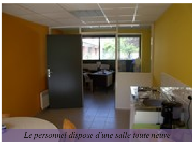
Le personnel dispose d'une salle toute neuve

La Municipalité et l'équipe de la restauration scolaire, emmenée par Christelle VOIRIN, se réjouissent de la construction de ces nouveaux locaux. Comme l'an passé, cette équipe proposera à nos enfants des menus diversifiés et équilibrés. Aussi, la commune devrait adhérer au plan national nutritionnel santé durant l'année.