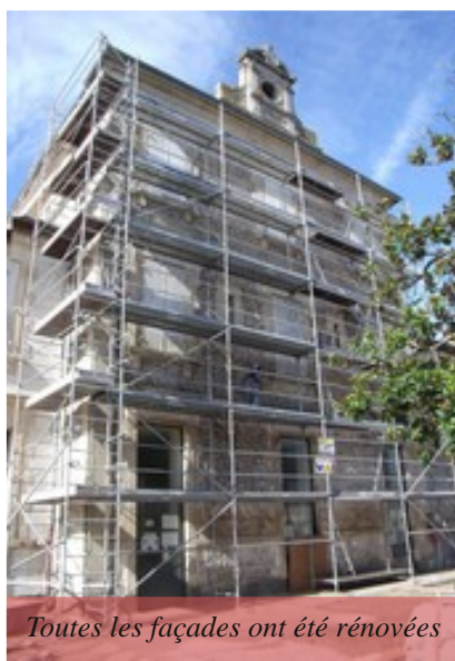
Toutes les façades ont été rénovées

Le premier étage du bâtiment ancien est entièrement réaménagé avec : - la création de quatre classes et d'une salle d'expression corporelle - la création d'un bureau pour le psychologue scolaire et de sanitaires - la rénovation totale des façades du bâtiment