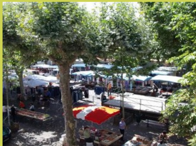
La contre-allée face à la Mairie est désormais utilisée

Les rues adjacentes ainsi libérées ont été rendues à la circulation.