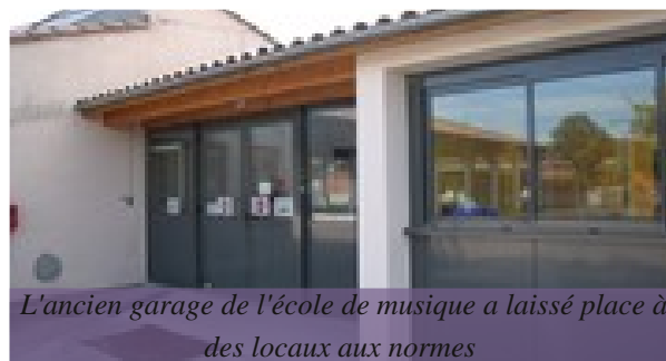
L'ancien garage de l'école de musique a laissé place à des locaux aux normes

Cet agrandissement a amélioré les conditions d'utilisation pour tous avec la création d'un sas couvert pour la réception des marchandises, un local poubelles, un bureau et une salle pour le personnel.