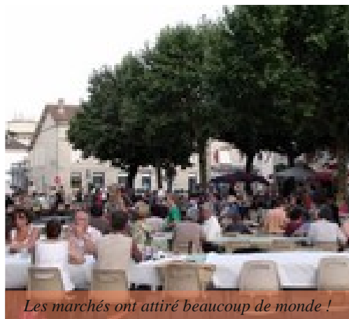
Les marchés ont attiré beaucoup de monde !

Ces marchés se sont déroulés entre le 22 juillet et le 12 août sur la place du 14 juillet et ont rencontré un véritable succès. Cette réussite est due à la diversité des stands d'une vingtaine de producteurs labellisés et à l'ambiance festive des concerts.