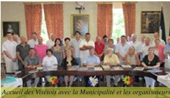
Accueil des Visétois avec la Municipalité et les organisateurs

Vendredi 9 juillet : Les Visétois sont arrivés dans l'après-midi, puis ont été conviés à la projection d'un film sur le 50ème anniversaire du jumelage. Un bal spécial « année 80 » s'est déroulé en soirée sous le chapiteau installé place du 14 juillet.