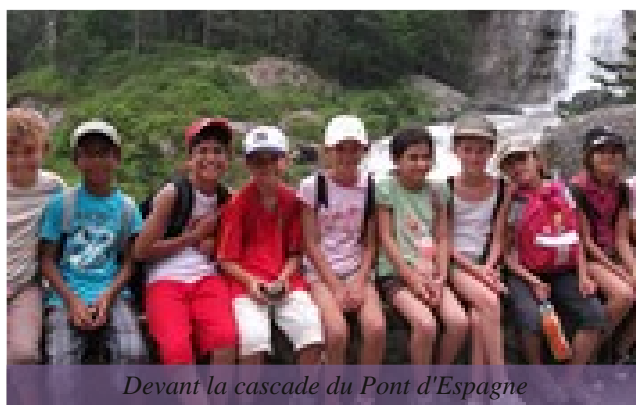
Devant la cascade du Pont d'Espagne