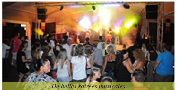
De belles soirées musicales

Dimanche 11 juillet : Le serment du jumelage a été renouvelé et la confrérie de l'Oie a intronisé de nouveaux membres. La journée s'est poursuivie avec un repas gascon et des animations musicales.