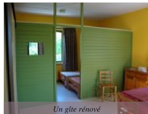
Un gîte rénové

Les dix gîtes ont été repeints, décorés et équipés pour améliorer le confort des locataires. Pour faciliter l'accès aux personnes à mobilité réduite, les sanitaires ont été entièrement rénovés.