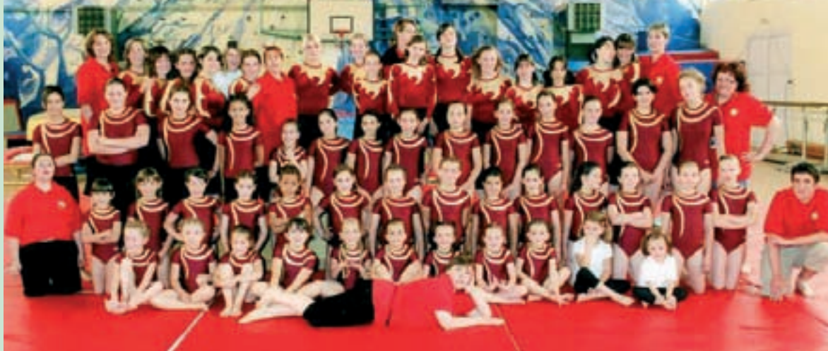
Les équipes du SCA Gym avec leurs entraîneurs