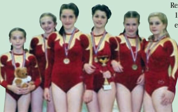
Des médailles bien méritées pour cette belle saison

Le SCA gym artistique vous souhaite une très Bonne Année 2008 !