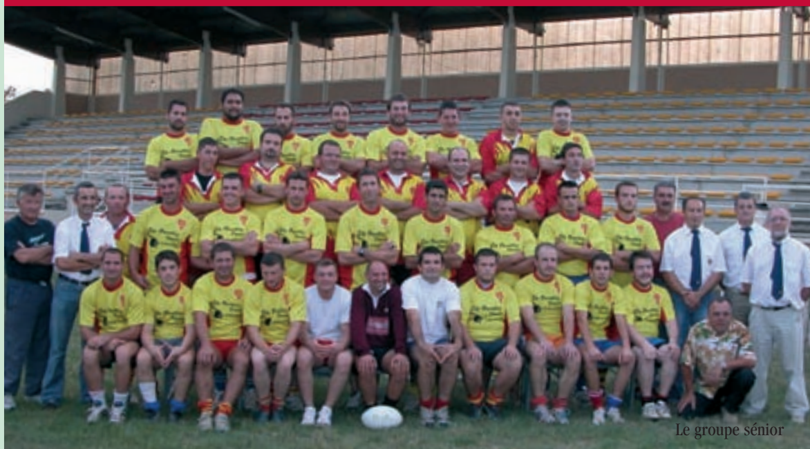
Le groupe sénior

Engagé cette saison dans le groupe promotion d'honneur du championnat de Périgord-Agenais, s'est renforcé à l'intersaison avec l'objectif de figurer dans les quatre premières places de la poule. La saison a bien débuté, dans le contexte général dynamisé par la coupe du monde de rugby, dont l'effervescence aura largement contribué à doubler les effectifs de notre école de rugby. Rendez-vous au mois d'avril 2008, nous l'espérons pour les phases finales.