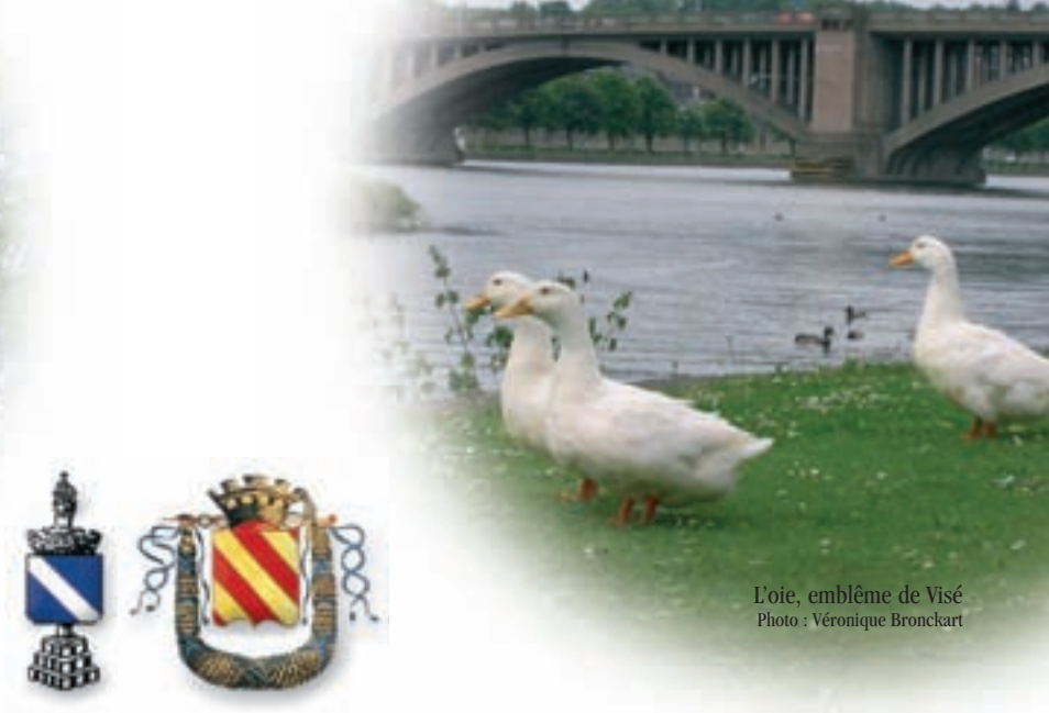
L'oie, emblème de Visé