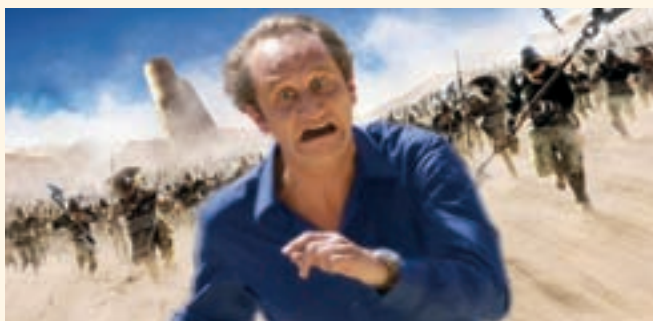
Actuellement à l'affiche au Cinéma Confluent : "Les deux mondes" avec Benoit Poilvoorde

Cette 3 ème année d'exercice nous a permis de confirmer un nombre d'entrées stable (12 000) et donc d'asseoir la notoriété de CINEMA CONFLUENT en ville et dans les villages de la Communauté de Communes même si bien sûr il reste beaucoup à faire.