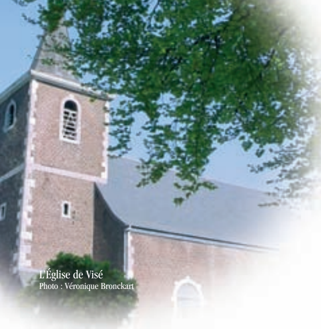
L'Église de Visé