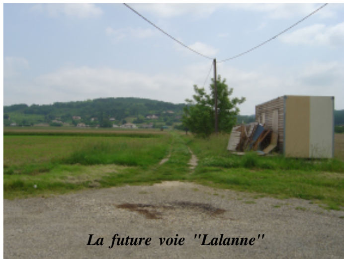
La future voie "Lalanne"

D'autre part un exutoire au réseau pluvial sera créé au bas de la rue de la République. L'ensemble de ces travaux représente un investissement de 74 000 €.