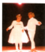
Rire, humour, parodies