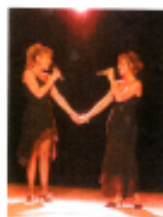
Chansons, émotions ...

Un seul objectif : Vous faire plaisir en nous amusant ! Et vous proposer des spectacles variés dans lesquels la fantaisie et la joie de vivre sont les maîtres mots ! Ni strass, ni paillettes, ni prise de tête, mais création et émotion