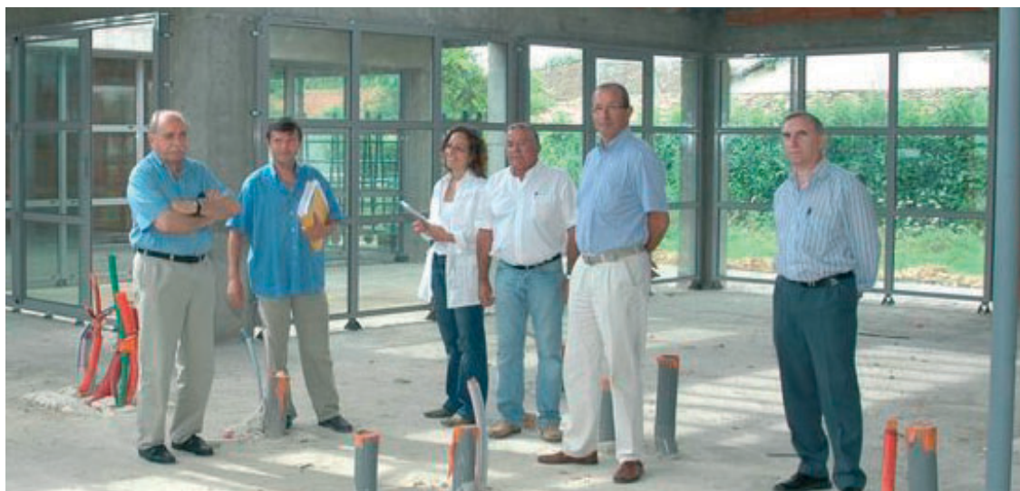
Les élus et les Services Techniques surveillent la construction de la crèche

Si l'été est pour la plupart d'entre nous la saison des vacances, ce n'est pas le cas pour de nombreuses entreprises ni pour les Services Techniques de la Ville : en général -sauf pendant l'été exceptionnellement pluvieux que nous venons de connaître-, le beau temps permet aux métiers du bâtiment de travailler avec plus de facilité ; les locaux à transformer sont moins occupés du fait des congés (c'est le cas notamment des travaux à réaliser dans les écoles). Donc, côté travaux et aménagements, notre ville a connu une activité intense au cours des mois d'été.