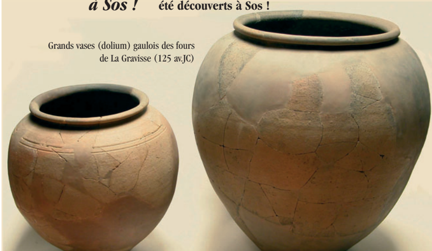
Grands vases (dolia) gaulois des fours de La Gravisse (125 av.JC)