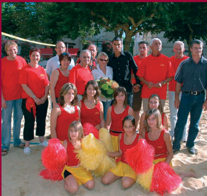
M. le Maire et le Dr Reginato aux côtés des sportifs