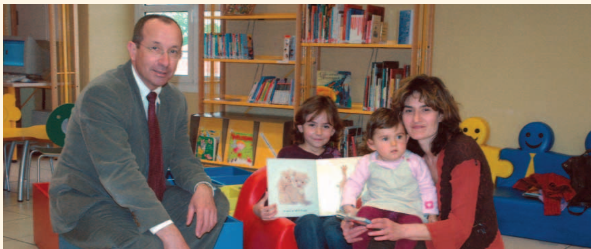
Monsieur le Maire à la Médiathèque