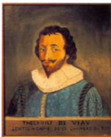
Le poète Théophile de Viau (1590-1626), naquit à Boussières entre Aiguillon et Port-Sainte-Marie.