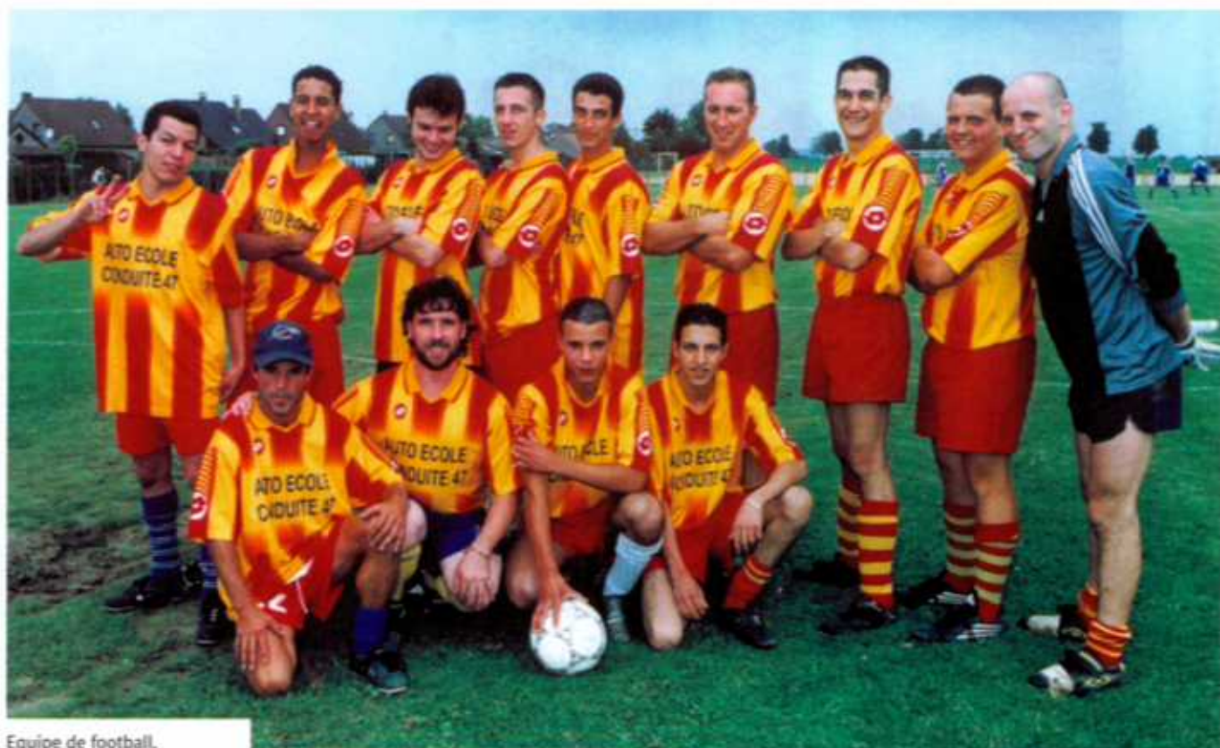
Equipe de football.