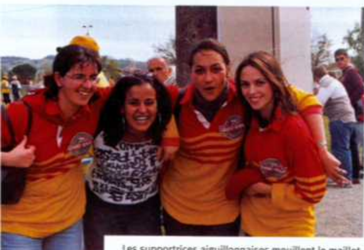
Les supportrices aiguillonaises mouillent le maillot.