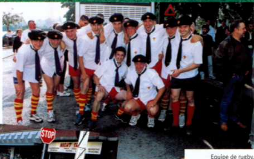
Equipe de rugby.