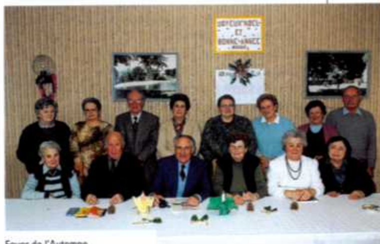
Foyer de l'Automne.

Tarifs : adultes = 9 €29 ; mineurs et étudiants (sur présentation d'un justificatif) = gratuit.