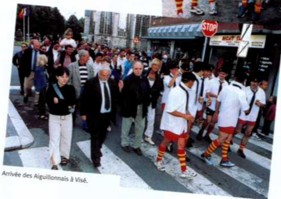
Arrivée des Aiguillonnais à Visé.