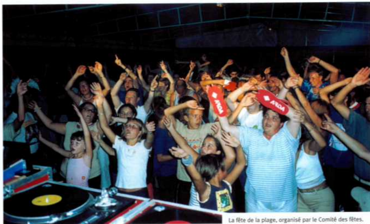
La fête de la plage, organisé par le Comité des fêtes.

Samedi 22 mars : carnaval, défilé de chars dans les rues de la ville, suivi d'un repas dansant.