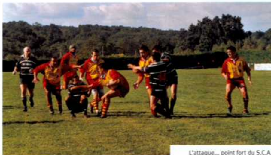
L'attaque... point fort du S.C.A.