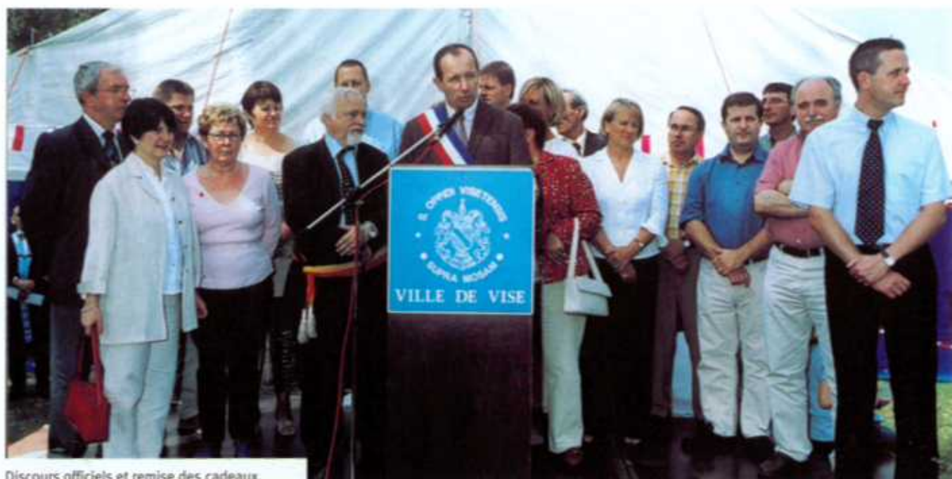
Discours officiels et remise des cadeaux.