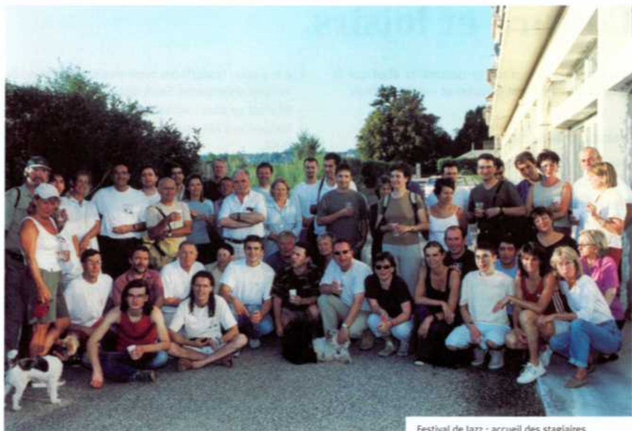
Festival de Jazz : accueil des stagiaires.

Samedi 26 avril : soirée mexicaine avec spectacle et repas dansant.