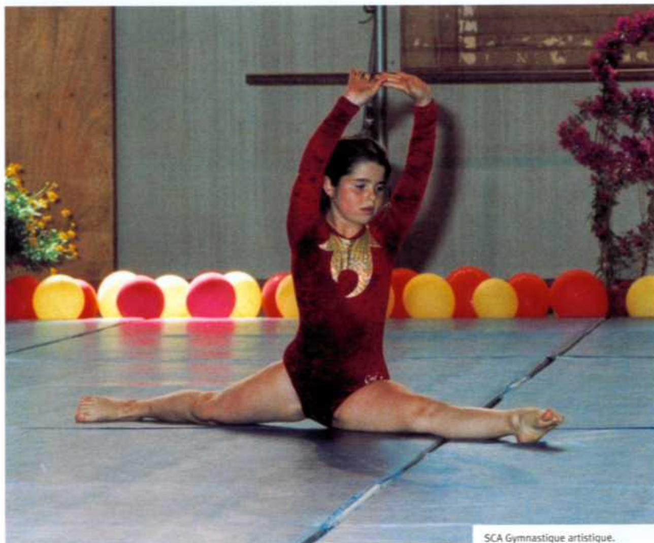
SCA Gymnastique artistique.

Nous avons également une section baby gym pour les enfants de 3 ans, et une section éveil gymnique pour les enfants de 4 à 6 ans.