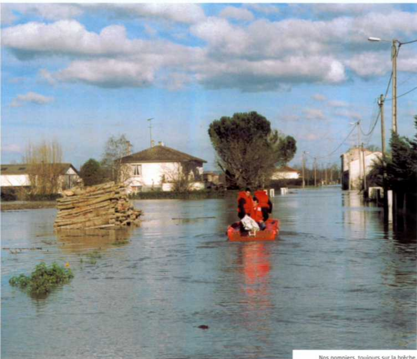
Nos pompiers, toujours sur la brèche.