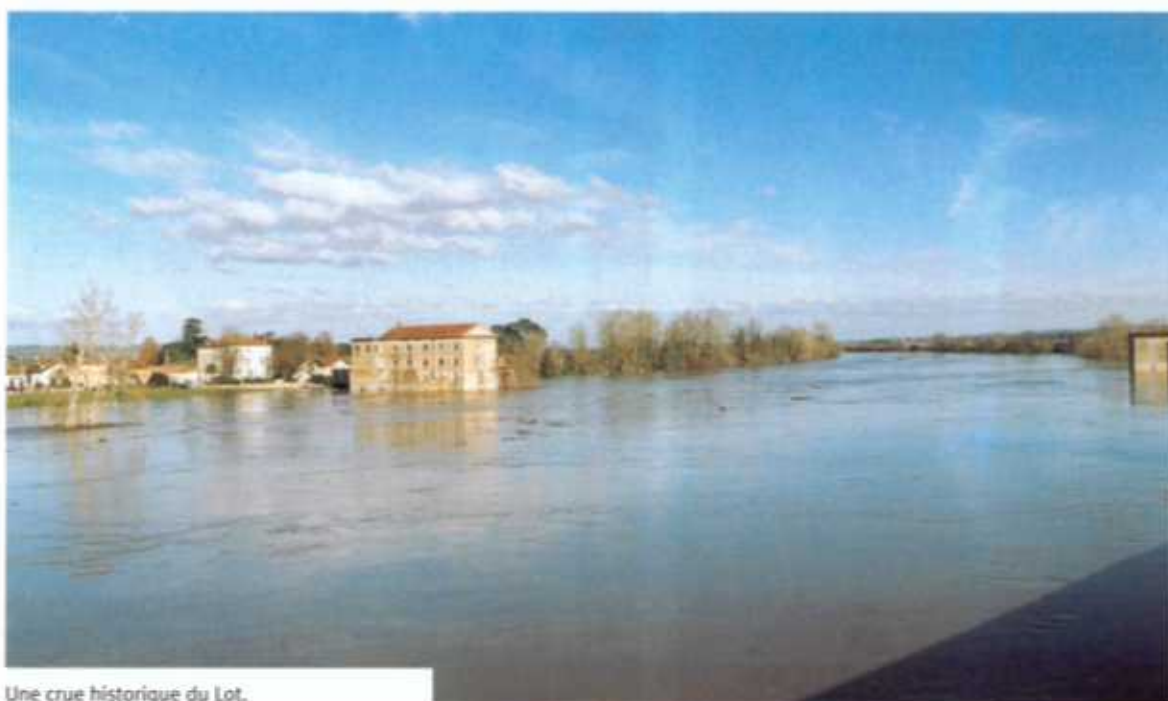
Une crue historique du Lot.

A peine étions-nous remis de notre été caniculaire que les inondations sont venues, pour la deuxième fois de l'année perturber notre vie quotidienne. Gonflée par les eaux du Tarn et du Lot, la Garonne est sortie brutalement de son lit, inondant la plaine.