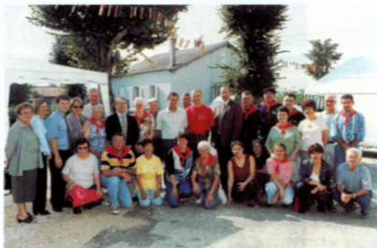
Le Comité des fêtes de St-Côme accueille la population et les élus.