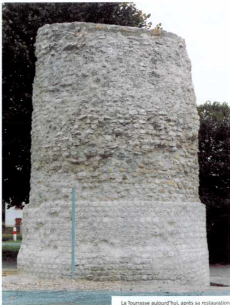
La Tourrasse aujourd'hui, après sa restauration.

L'ouvrage trônera désormais dans un jardin aménagé. La tour sera éclairée par la base, et la lumière destinée à mettre en relief ses pierres montrera le monument dans toute sa splendeur comme il était il y a deux mille ans. Une étude pour l'aménagement de la périphérie est actuellement en cours.