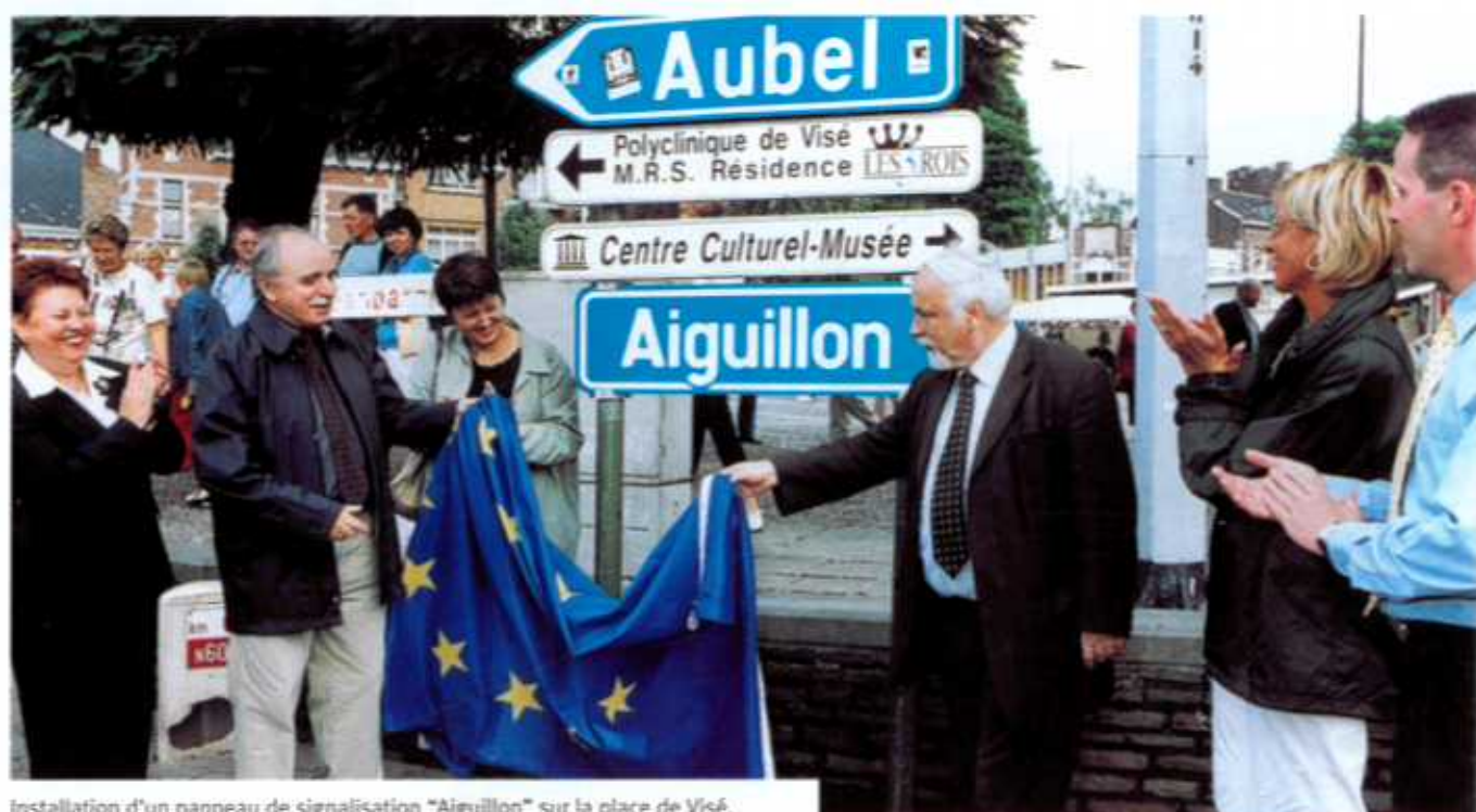
Installation d'un panneau de signalisation "Aiguillon" sur la place de Visé.