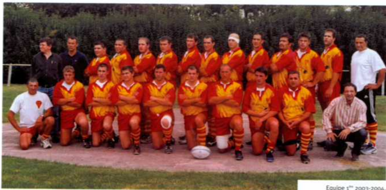
Equipe 1 ère 2003-2004.