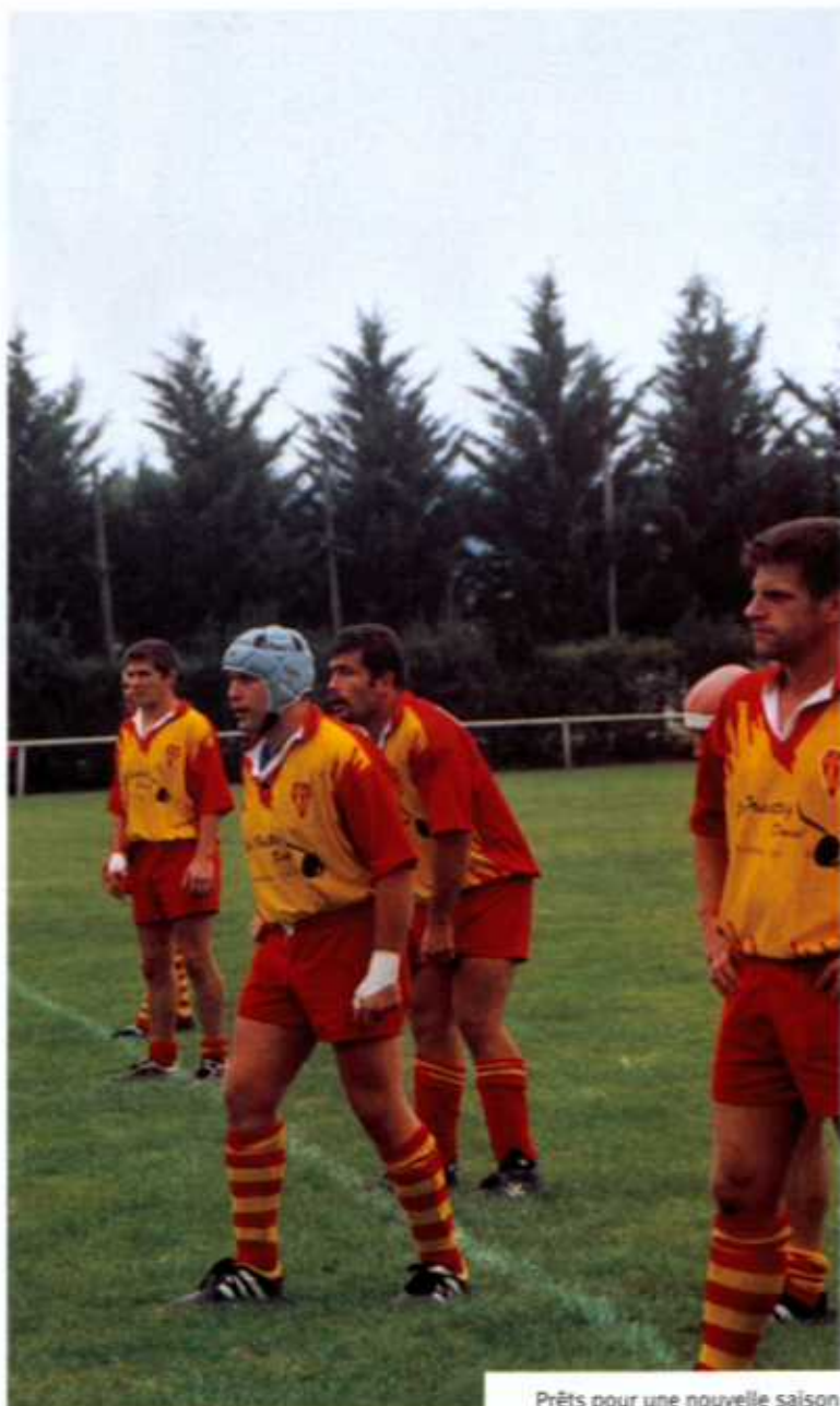
Prêts pour une nouvelle saison.

Les bénévoles, les dirigeants, les joueurs et tous les membres actifs du Sca rugby vous attendent au stade et vous souhaitent une très bonne année 2004.