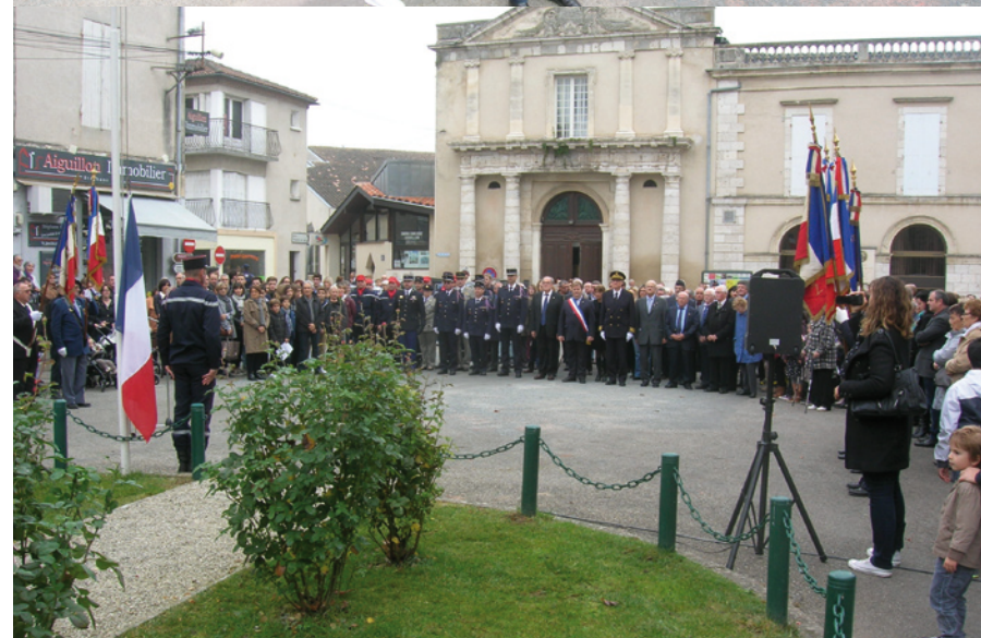
Avec la participation des enfants de l'École Marcel Pagnol