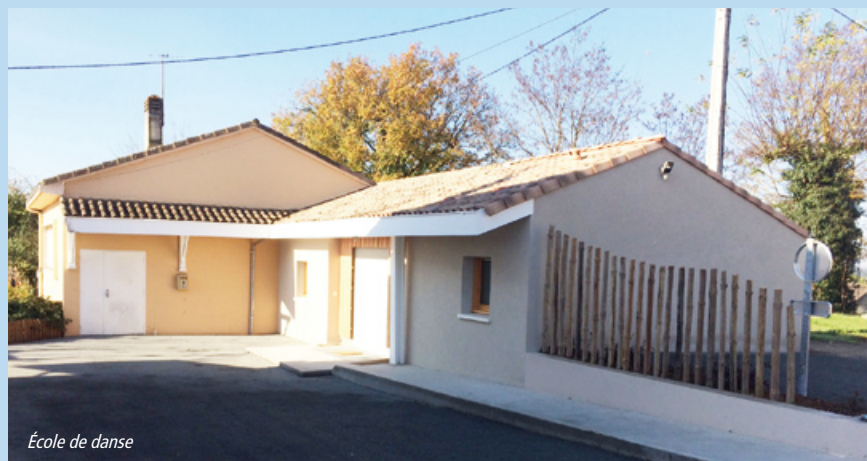
École de danse