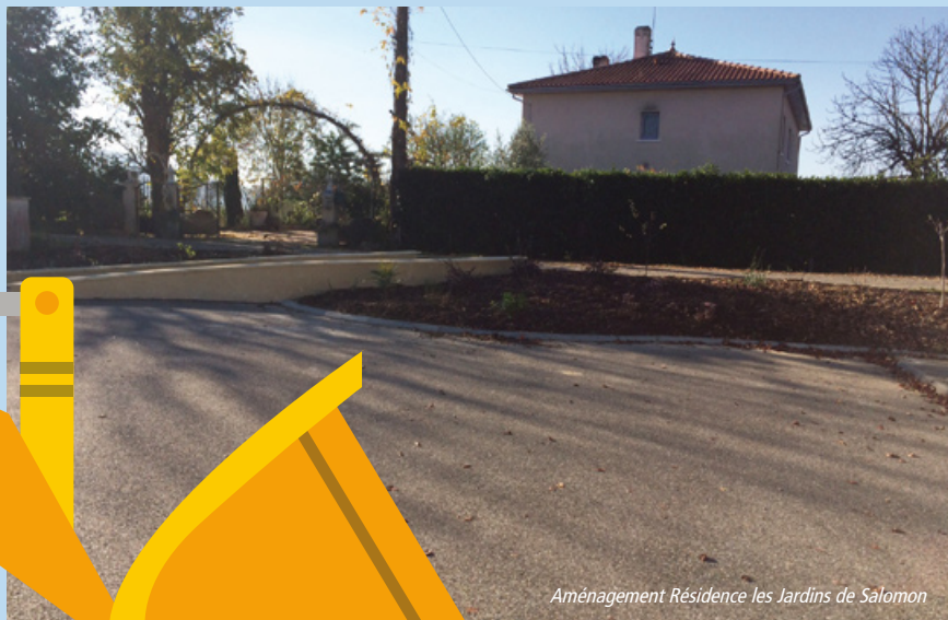
Aménagement Résidence les Jardins de Salomon