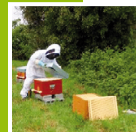
L'apicultrice au travail, pour la commune... et les abeilles !

Ces ruches ont vocation à être installées sur le domaine communal à bonne distance des habitations, afin de favoriser la présence et la protection des abeilles au sein des jardins et des espaces naturels de la ville. Cette opération est également menée afin de sensibiliser les aiguillonais à l'activité et l'importance des abeilles dans la pollinisation et la conservation de la biodiversité.