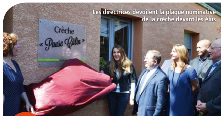
Les directrices dévoilent la plaque nominative de la crèche devant les élus