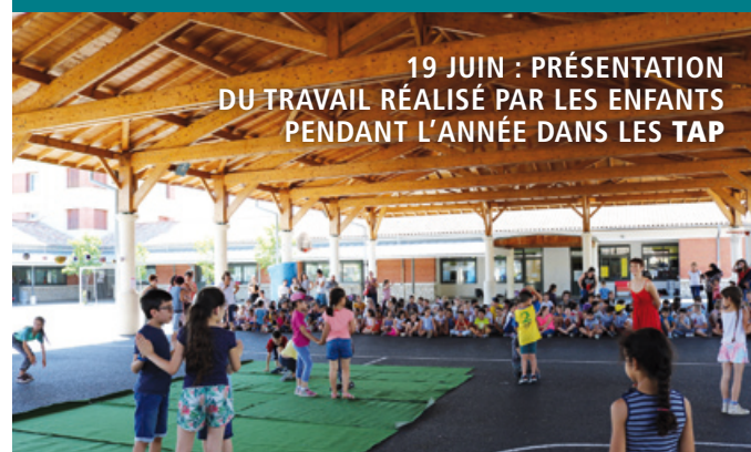
19 JUIN : PRÉSENTATION DU TRAVAIL RÉALISÉ PAR LES ENFANTS PENDANT L'ANNÉE DANS LES TAP

Et pour notre plus grand plaisir, Zoé reviendra à la médiathèque d'Aiguillon le samedi 29 septembre à 11h pour un spectacle sur le thème bien sûr de la rentrée « A l'école Zoé » !