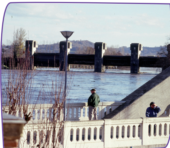
Le barrage du Temple sur Lot - Castelmoron lors de la crue de 2003 Amont et aval au même niveau !