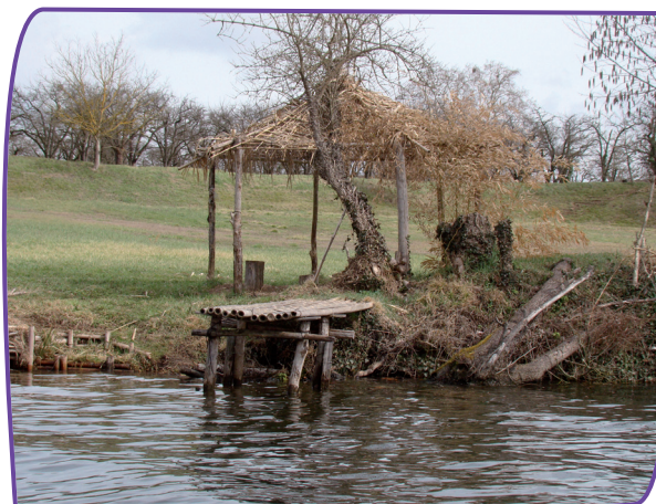
Ponton fait en matériaux naturels

Pour aménager un poste de pêche, vous pouvez être amené à débroussailler partiellement la berge.