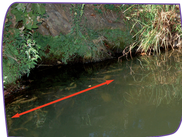
Berge sous cavée.

Observez si elle est creusée dessous (= sous cavée), sondez le bord avec un bâton pour voir quelle est la profondeur, regardez aussi si c'est de la terre ou du rocher.