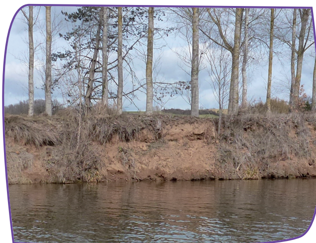
Erosion et peupliers sur la berge : végétation mal adaptée.