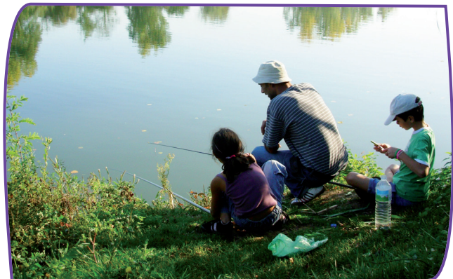
Le Lot a une grande renommée en matière de pêche

Toutes les embarcations, avec ou sans permis, doivent respecter les dispositions du RPP.